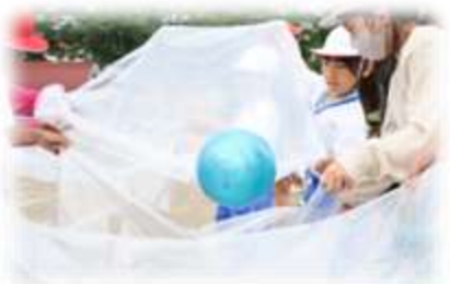
5月8日(金)、児童会種目全体練習

学年部種目練習、赤白応援練習、サンヨ節練習等、運動会に向けて子供たちは頑張っています。