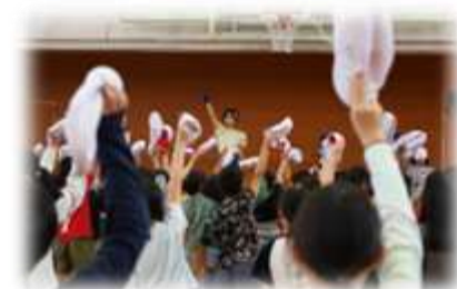
5月8日(金)、応援練習(白組)