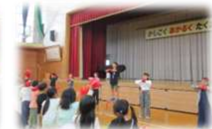
5月8日(金)、応援練習(赤組)

職員も、練習中の児童への指導や支援だけでなく、各種準備等に頑張っています。先週は、ホームストレートのコースロープ設置やマーカー敷設、ライン引きなど時間の掛かる作業を行いました。当日は、子供たちの頑張る姿だけでなく、環境を整えた職員の頑張りにも注目してください。