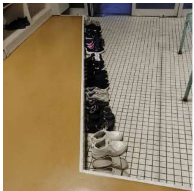
6月1日(月)19:00頃、体育館玄関 スポーツ少年団「ジュニアバレーボールクラブ」

*毎回きれいに並んでいる靴に感動しています。 *もちろん他の団体の方もきれいに並んでいます。