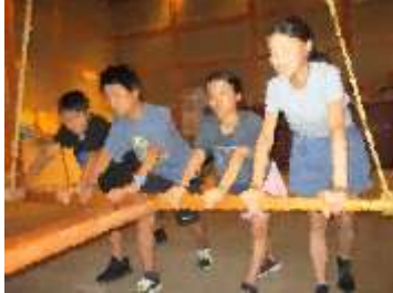
佐渡奉行所・勝場(せりば)