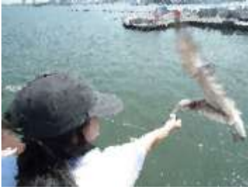
新潟港発カーフェリー