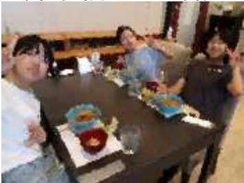
昼食(天然ブリカツ丼)