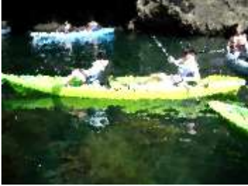
シーカヤック体験