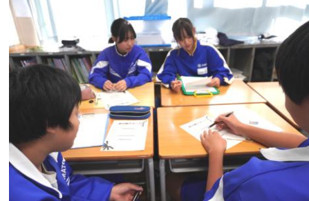
6年 大和中学校区 絆集会・いじめ見逃しゼロスクール集会