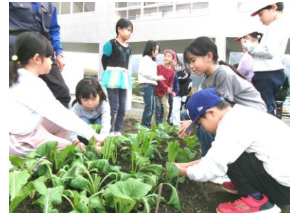
3年 大崎菜の植え替え