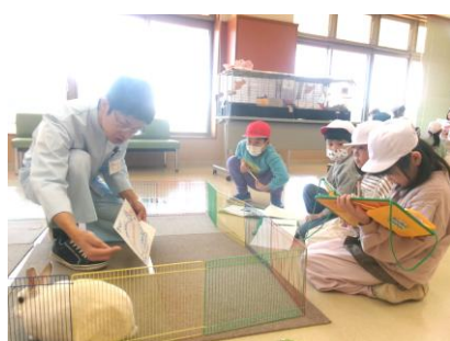
1年 動物愛護センター見学