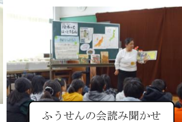
ふうせんの会読み聞かせ