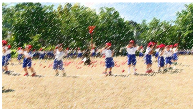
1・2・3年チェッコリ玉入れ