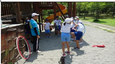
令和3年五十沢キャンプ場の活動