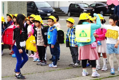
↑ 朝のあいさつ運動