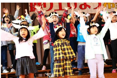
↑ ヤギさんの耳を付けて学習発表会