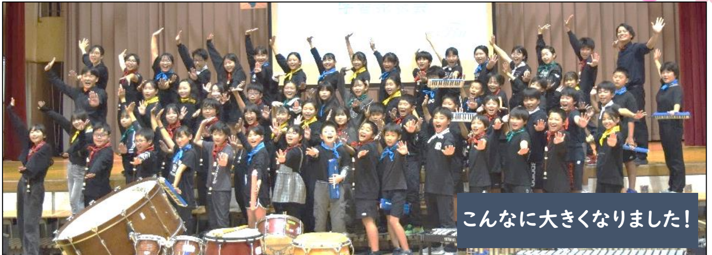
こんなに大きくなりました!