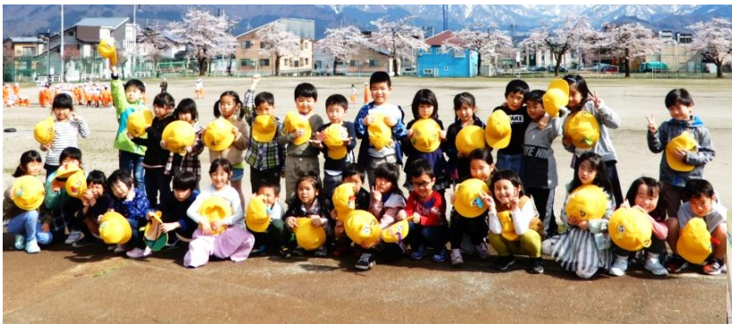
↑ 1年1組 満開の桜の前で