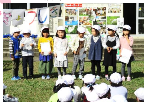
↑ ヤギさんの卒業式