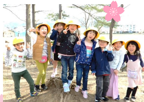
↑ 自然林でのひとこま