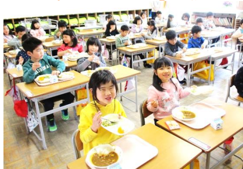
↑ はじめての給食はカレー