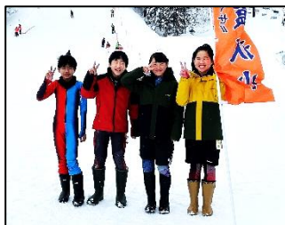
↑アルペン競技に出場した選手