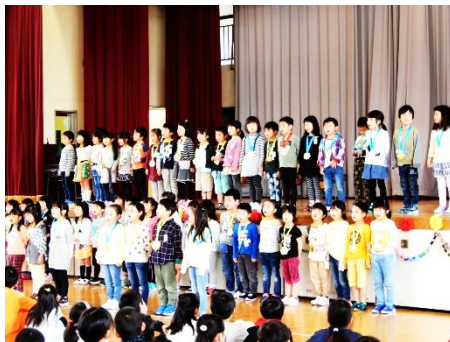
↑ 1年生を迎える会での様子