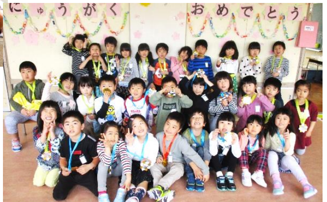
→ 1年2組 1迎会のあと教室で