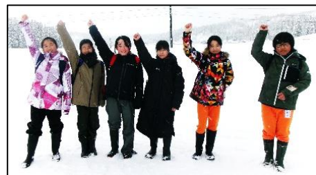
↑クロカン競技に出場した選手