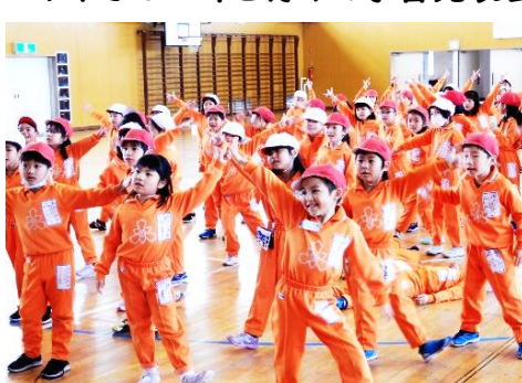
↑ 6感会の出し物練習

卒業式まで五年生が中心となり学校全体で「ありがとうウイーク」を開催しています。六年間の思い出や中学校に向けての抱負など、六年生から一日三人程度放送してもらおう「給食インタビュー」や、在校生から六年生への「メッセージカード作り」などを行いつつ、最後の思い出づくりを大切にしています。