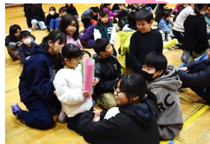
← 「6年生へ感謝する会」 三月五日(水)に5年生が中心となり、心温まる会が行われました。

↑ 昨年度、塩沢小学校後援会と様よりいただいた「卒業記念パネル」の前で、大勢の子供たちが記念写真を撮っていました。