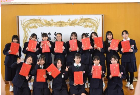
↓ 卒業式後、担任の先生と一緒に記念写真

3月24日(月)、この1年間塩沢小学校のリーダーとして全校を立派に導いてきた6年生62名が塩沢小学校を巣立ちました。卒業証書を手にした6年生の凛々しい姿と引き締まった表情から、中学校への覚悟と決意を感じることができました。6年生の皆さんの、これからの健康と更なる成長を心から願います。