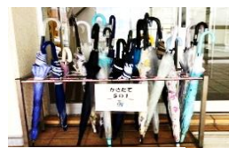
←学力テストの結果

もちろん、これら10個の項目については、すべての子供ができていいるわけではありません。できていない部分もたくさんあることと思います。ですが、子供たちの姿を見ると、このような良さを見せる子がとても多くなってきました。