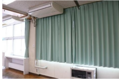
←五・六年生教室の カーテン