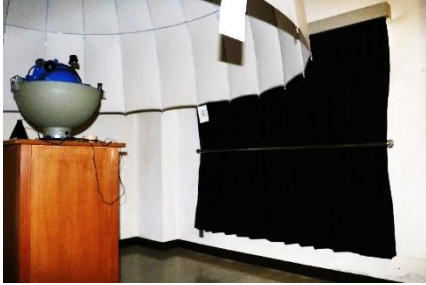
←プラネタリウムの 暗幕

コロナ禍で活動が減ったことにより繰り越されてきた PTA 会費の一部と、後援会費より支出をしていただきました。大変ありがとうございました。大切に使うべく、子どもたちにも指導をしていきます。