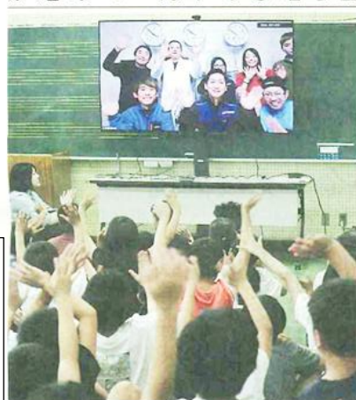
南極・昭和基地と塩沢小をつないで開いた南極教室＝南魚沼市塩沢

南極にいたる観測隊員と児童が交信する「南極教室」が、南魚沼市塩沢の塩沢小学校で開かれた。5、6年生の約120人が、日本から約1万4千km離れた南極基地と衛星を通してつながった。塩沢小の卒業生の隊員から、南極の生態系や観測隊員の暮らしを学んだ。