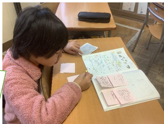
自学交流会の様子

保護者の皆様からは、学校の取組をご理解いただき、ご協力いただき、大変ありがとうございます。子供たちの家庭学習の取組が少しずつ変わってきていることを実感しています。今後も引き続きお子さんを見守っていただき、「できなかったことができるようになったね。」「文字がきれいに書けるようになったね。」などと子供たちの頑張りを認め励ましていただけるとありがたいです。