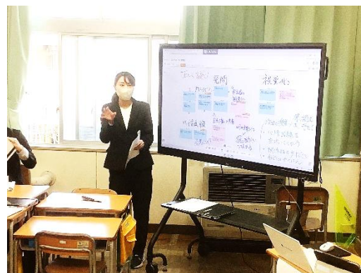
←職員の授業研究会の様子