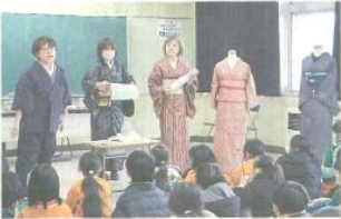
塩沢小の3年生が着物について学んだ授業 ＝南魚沼市塩沢