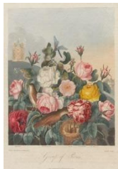
ロバート＝ジョン・ソートン『フローラ的神殿』1812年 (「シークレット・ガーデン」より)

庭—この言葉から、人は何を思い浮かべるでしょうか。丹精込めて造成された庭園、ご自慢の花壇や家庭菜園、あるいは自分だけの秘密の空間。様々な美術作品を通して、無限の想像力をかきたてる庭というものを味わってみましょう。