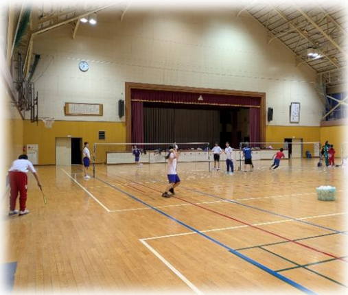
こぼどクラブ(バドミントン)

国は、令和5～7年度の3年間を「改革推進期間」として、休日の中学校部活動の地域移行(地域展開)を進めてきました。令和8年度からは「改革実行期間」とし、令和8～10年度を前期、令和11～13年度を後期、計6年をかけて、さらに部活動地域展開を進めていくこととしています。